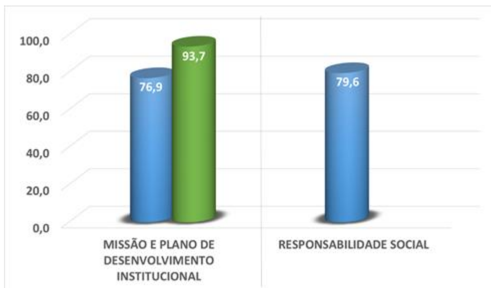
Imagem 2 – Missão e PDI e Responsabilidade Social 2018/1 – Alunos

O eixo 2 é representado pelas dimensões 1 (missão e plano de desenvolvimento institucional - PDI) e 3 (responsabilidade social) do SINAES e, conforme imagem 2, alunos da graduação demonstram satisfação com a Missão e PDI, sendo essa satisfação foi menor que para os alunos de 2017, pois em 2018/1 tivemos o ingresso de alunos que não tiveram o mesmo contato com a missão e o plano de desenvolvimento institucional – PDI. Destes, 76.9% indicam que as ações da Faculdade condizem (sempre e muitas vezes) com sua missão. A satisfação por parte dos alunos é refletida em seus comentários.