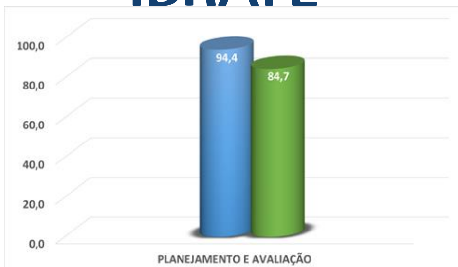
Imagem 1 – Planejamento e Avaliação Institucional 2018/1 – Alunos

Se por um lado são notáveis os pontos fortes neste processo, algumas sugestões também aparecem para sua melhoria, tais como a maior divulgação das melhorias que têm sido feitas a partir dos resultados da Avaliação Institucional. Sendo assim, dentre outras estratégias de divulgação, aproveitamos para apresentar algumas melhorias realizadas, subsidiadas também, pelo processo de auto avaliação Institucional na Faculdade de Tecnologia IBRATE nos últimos anos: