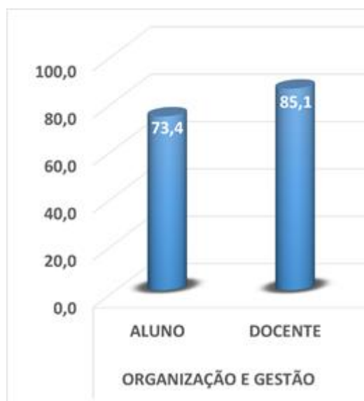
Imagem 4 – Organização e gestão 2018/1 – Alunos e docentes

O eixo 4 engloba a avaliação das dimensões 5 (Políticas de Pessoal), 6 (Organização e Gestão) e 10 (Sustentabilidade Financeira) avaliados pela graduação 2017, conforme organização e planejamento do ciclo auto avaliativo, definido pela CPA.