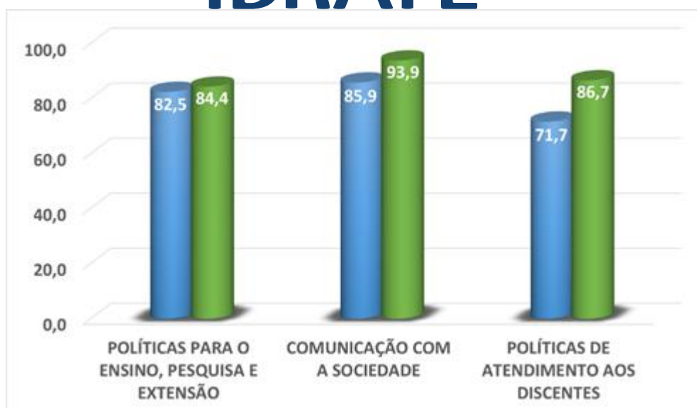
Imagem 3 – Políticas para o Ensino, Pesquisa e Extensão; Comunicação com a Sociedade e Políticas de Atendimento aos Discentes – Alunos

Alunos demonstram grande satisfação quanto a comunicação com a sociedade, apresentam percentuais de 85.9% (2018/1) e 93.9% (2017), indicando que as ações de comunicação ocorrem adequadamente sempre e muitas vezes. De acordo com os comentários de alunos, as ferramentas utilizadas para a comunicação despertam a atenção dos alunos para a programação institucional e atendem as necessidades, além disso, o Site da Faculdade está sempre atualizado e os murais apresentam conteúdo claro e objetivo, informando-os a respeito dos eventos, palestras, congressos e demais atividades que acontecem na Faculdade ou na Comunidade Acadêmica.